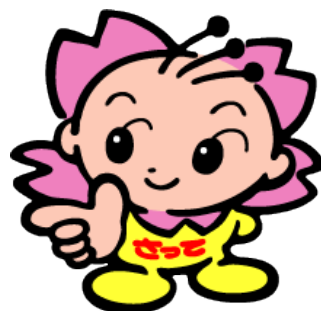
幸手市マスコットキャラクター さっちゃん