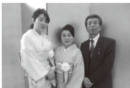
会長（中央）及び副会長

当協会は、1月末に20周年記念式典を行うことができました。 これは、歴代の役員・会員皆様のご尽力のみならず、幸手市をはじめとする関係各位のご支援の賜物と深く感謝申し上げます。この節目を新たな発展に向け、これまで培ってきた経験をもとに、行政との連携を深めながら、幸手市の国際化に向けて取り組んでゆく所存であります。 これからも、なおいっそうのご支援ご協力のほど、よろしくお願い申し上げます。