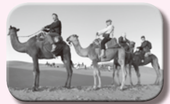
(↑モロッコにて) (←パリ・エッフェル塔)