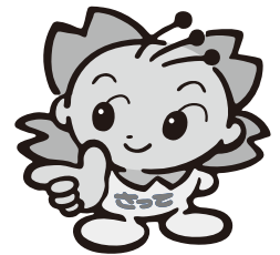
幸手市マスコットキャラクター さっちゃん