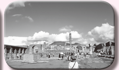
(↑イタリア・ポンペイ遺跡にて)