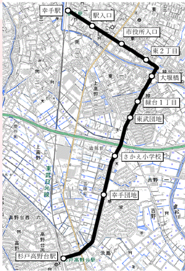
幸手駅～杉戸高野台駅路線