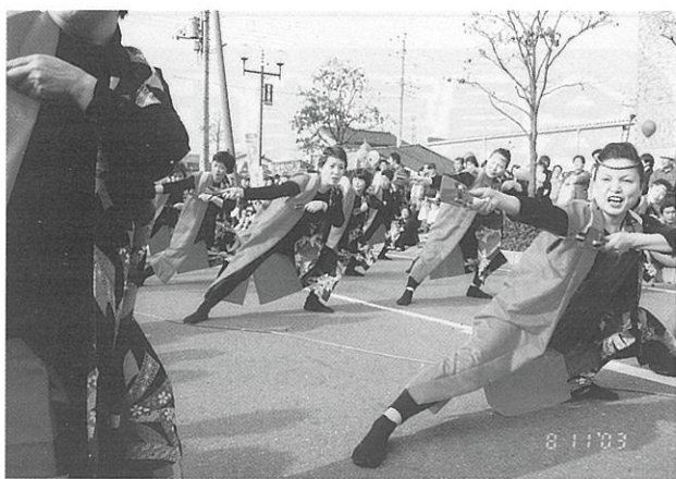
ヨサコイソーランで日本の文化を披露

また、南米の音楽演奏や空手演舞などのパフォーマンスも、たくさんのギャラリーでにぎわいました。