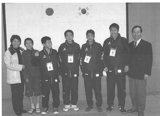
ホストファミリーと対面。まだちょっと緊張気味です。