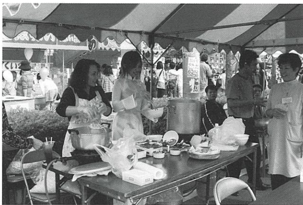
市民まつりの国際交流ひろば にたくさんの方が集まりました。

人気の世界のビールの試飲をはじめ、各国料理の販売やパフォーマンスの披露などを行いました。