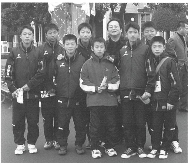
東京ディズニーランドに到着!!