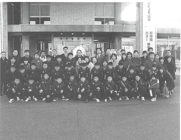
4日間ありがとうございました。また会おうね。

ホストファミリーのみなさんは、家族の一員となった子どもたちとの再会を願って、今では、韓国語の勉強を始めたとのこと。