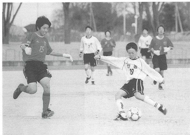
日本チームも韓国チームもどちらも頑張れ!!