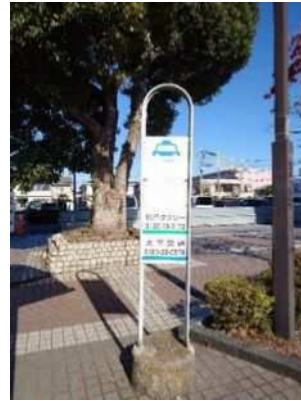
杉戸高野台東口駅前、タクシー乗り場(2025. 11. 17)