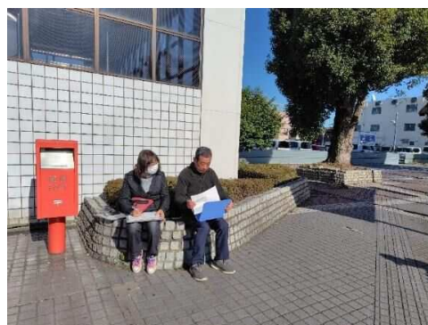
タクシー乗降者調査(2025. 11. 21/午前8時30分～午前11時30分)