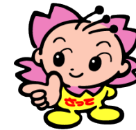
幸手市マスコットキャラクター さっちゃん