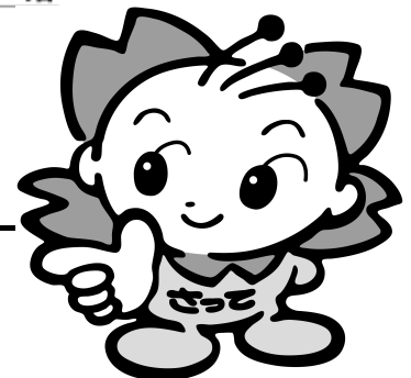
幸手市マスコットキャラクター さっちゃん