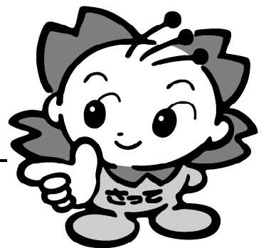
幸手市マスコットキャラクター さっちゃん