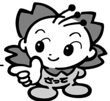
幸手市マスコットキャラクター さっちゃん