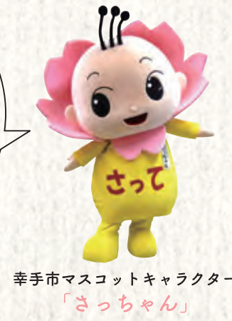
幸手市マスコットキャラクター「さっちゃん」