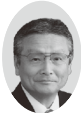
枝久保喜八郎議員