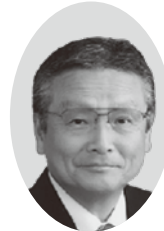
枝久保喜八郎議員