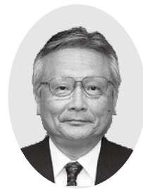
枝久保喜八郎議員