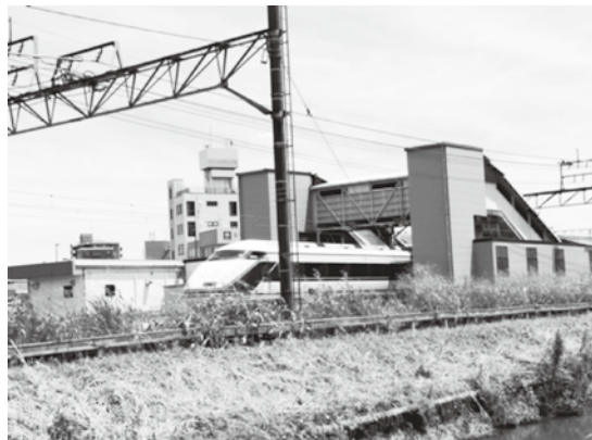
西側から駅舎を望む