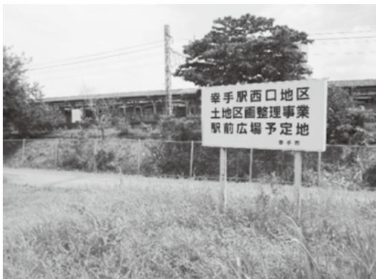
西口駅前広場予定地

※所管事務調査とは 常任委員会はその所管に属する事務について、自主的にテーマを設定して調査することができると定められています。