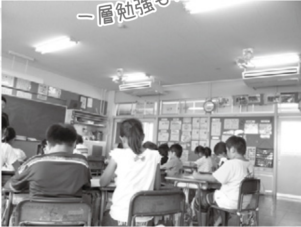
幸手小学校 授業風景

市内小・中学校の教室にエアコンが設置され、7月3日から使用されています。夏場の厳しい暑さの中、児童・生徒の皆さんに快適に学習していただくために行われたもので、各小・中学校の普通教室、特別教室、管理諸室を含む全ての教室(12校合計で339教室)に設置されました。