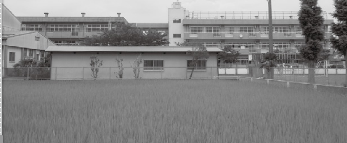
大規模改修される 行幸小学校前景