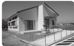
権現堂川小学校 さいかち児童クラブ