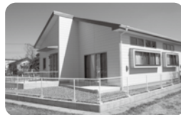
さくら小学校 さくら児童クラブ