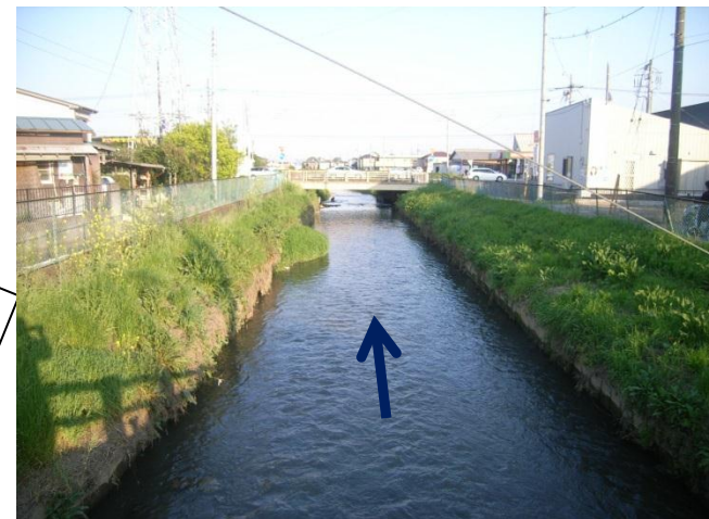
倉松川未整備区間 幸手橋(国道4号)上流