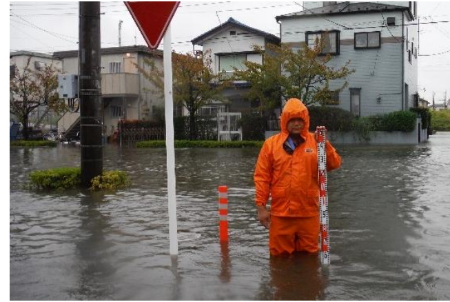
平成26年台風18号 大堰橋周辺地区(東さくら通り)