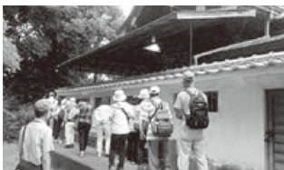
てくてくウォーキング