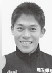
2017世界陸上日本代表 川内 優輝さん