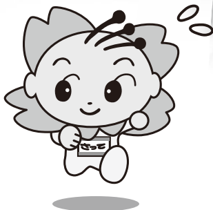
幸手市マスコットキャラクター さっちゃん