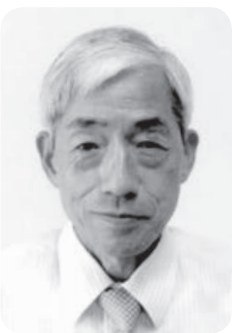
長倉支部 副支部長兼幹事長

今後も微力ながら、幸手市のスポーツ発展普及のお手伝いができればと思っております。