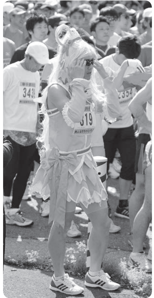
実は!! この方が1位で〜す