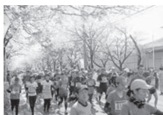
さってさくらマラソン

クラブ幸手はスポーツ推進委員が核になり企画運営しています。平成25年度も(6月現在)20以上の事業が体協各支部や地域の皆さんの協力で展開されています。スポーツのみに限らない、スポーツと文化のコラボを試みた次世代の会員制コミュニティークラブを目指しています。