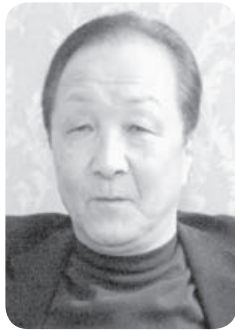
上高野支部副支部長

自分が若かりし頃経験した陸上競技で、少しでも協力することが出来ればと思いついたクラブです。白営業を営む私にとって、かけっ子クラブは、こども達と触れ合うことができる唯一の場であり、自身の健康維持の場づくりでもあります。これからも、子ども達との常に同じ目線に立ち練習することを心がけていきたいと思っております。