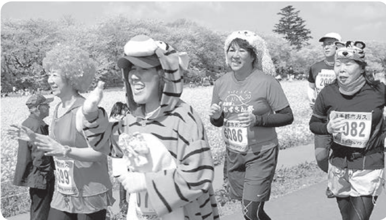
コスプレ 桜と菜の花