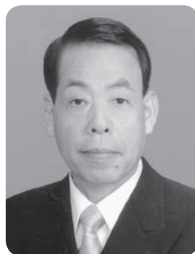
幸手市教育委員会