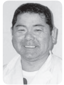
陸上競技協会理事