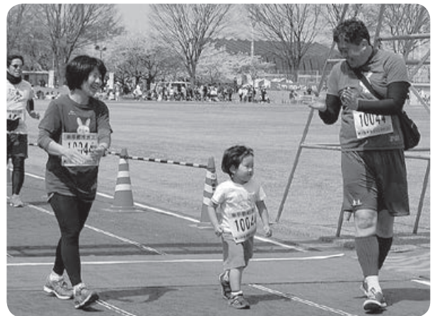
ほのぼのファミリーゴール