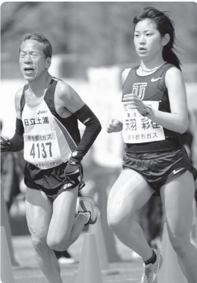
東洋大女子と一般男性の対決