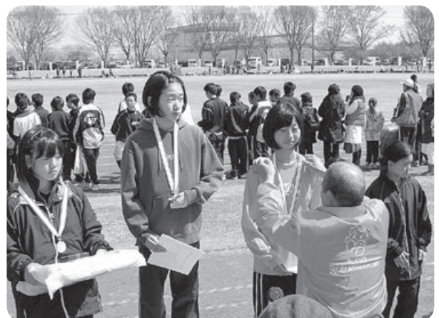
ふれあいコース優勝おめでとう!