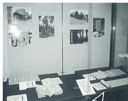
↑展示の様子 (お伊勢さんと武蔵)