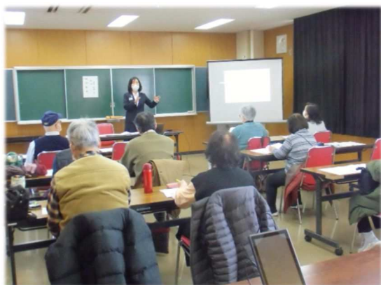
中央公民館 相続講座