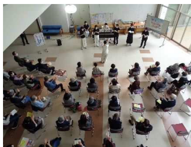
ランチタイムコンサート