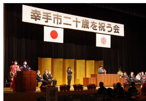
二十歳を祝う会式典

また、会の企画・運営を参加対象者で構成する実行委員会に委託し、「～雲外蒼天～」をテーマに会が行われ、294人が参加しました。開催にあたっては、座席間の間隔確保や来場時の検温・手指消毒などの新型コロナウイルス感染拡大防止対策を講じながら、式典とアトラクションを実施しました。