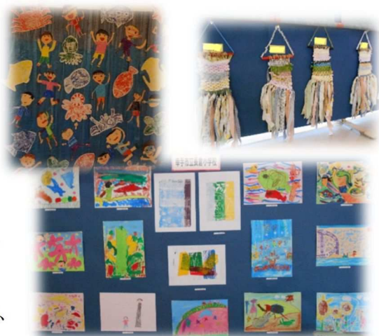
手をつなぐ子らの作品展

学校の教育活動に、保護者や地域の方々の協力を得て、児童・生徒がふれあいを通して、大人の思いや願い、郷土愛を感じながら学ぶ講演会。