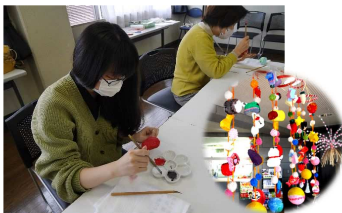
張り子のつるし飾りづくり