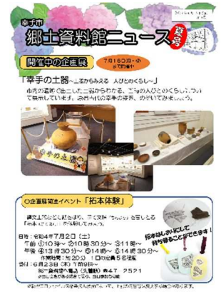
『郷土資料館ニュース』