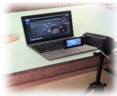
オンラインで学びに参加