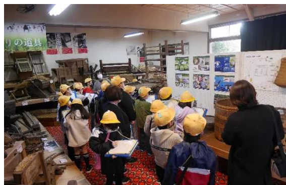
市内小学校社会科見学の様子

また、市内小学校の団体見学では、民具資料展示室において石臼での粉ひきや洗濯板体験など昔の生活体験を取り入れながら、ふるさと幸手の伝統的な生活文化や民具資料の普及啓発に努めました。