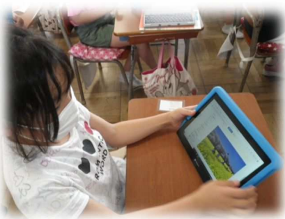
1人1台端末の利活用

児童・生徒1人1台貸与されている学習者用端末を活用し、「個別最適な学び」と「協働的な学び」の一体的な推進を図りました。日常の授業だけでなく、家庭学習としても学習者用端末が当たり前のように活用されるようになりました。アプリを使うことで、教職員が即時的に児童・生徒と繋がることのできるため、欠席等の場合にも、家庭からオンラインで学びに参加することができるようになりました。