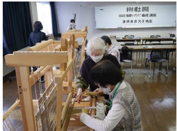
機織り体験学習市民ボランティアの養成