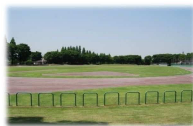
幸手総合公園陸上グラウンド