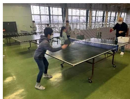
放課後子ども教室 卓球教室

吉田小学校にて卓球教室と和太鼓教室の2教室を開催しました。新型コロナウイルス感染拡大防止対策を講じて40回開催し、延べ427人の児童が参加しました。