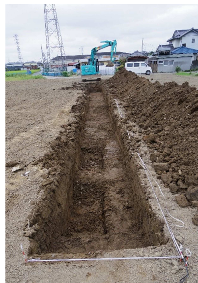
埋蔵文化財の試掘調査（下川崎地内）