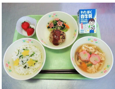
【権現堂桜堤を イメージした献立】