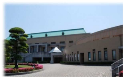
市民文化体育館（アスカル幸手）