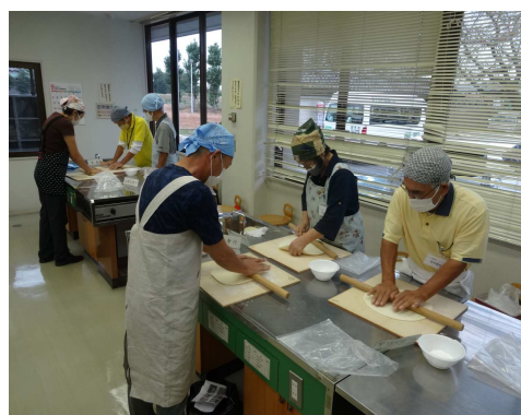
東公民館 手打ちうどん体験講座