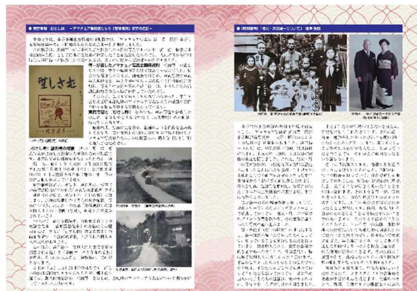
『幸手市文化遺産だより』第20号の表紙と本文