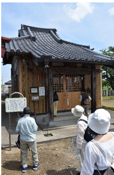
修繕した文化財案内板を読む見学者（槇野地 子の権現社）

小学校のクラブ活動において囲碁クラブを設置し、その指導者を団体に依頼しました。年間を通して継続的に指導いただく機会を設けました。