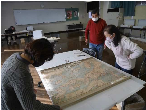
古文書整理市民ボランティアの養成

郷土資料館収蔵資料調査事業を推進するため、古文書等整理市民ボランティアを養成しました。また、ものづくり体験学習事業を実施するため、機織り体験学習市民ボランティアを養成しました。