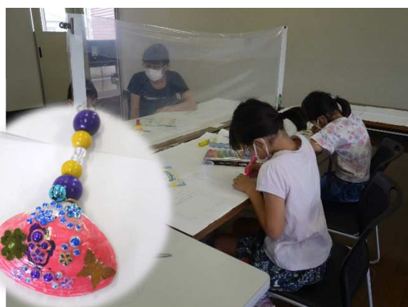
貝のストラップづくり