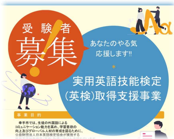
英検団体受験の実施

外国語指導助手（ALT）8人を市内各小・中学校に配置し、児童・生徒の英語への興味・関心を高めるとともに、第一言語が英語の外国人指導助手と授業やそれ以外でコミュニケーションをとることで、知識・技能、思考力・判断力・表現力、そして主体的な学びにつながる姿勢を養うための指導を実施しました。