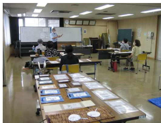
北公民館 淡墨によるやさしい一字書の創作講座