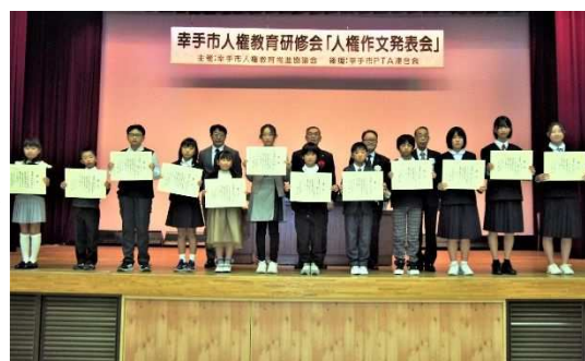
幸手市人権教育研修会 「人権作文発表会」の様子

また、12月には、市内小・中学生代表が人権作文発表会に参加しました。さらに、埼玉人権施策推進協議会が主催する「埼玉郡市教職員合同現地研修会」への教員の派遣、管理職及び若手教員を対象とした研修会を2月に開催し、人権意識の高揚と指導力の向上を図りました。