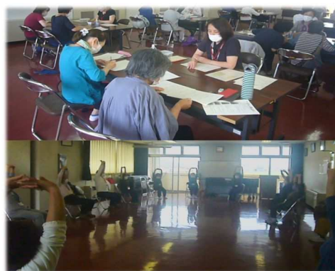
西公民館 脳と体の健康教室