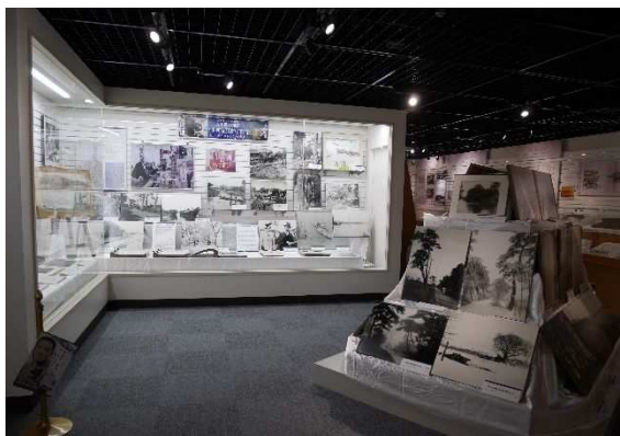
特別展の様子

民具資料展示室として活用している旧吉田中学校校舎は、戦後間もない時期に建設された新制中学校の木造校舎として希少性の高い文化財であることから、今後の保護と活用について検討する必要があります。