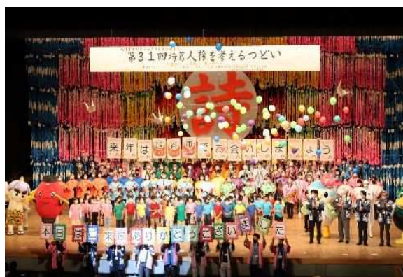
埼玉人権を考えるつどい