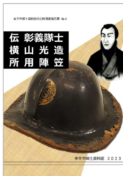
『幸手市郷土資料館文化財調査報告書 No.4 伝 彰義隊士 横山光造所用陣笠』