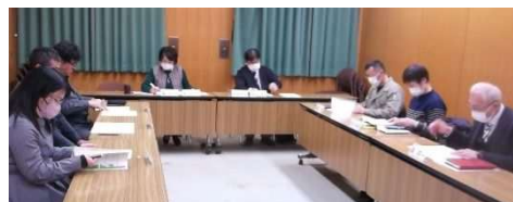
令和8年2月17日 会議の様子