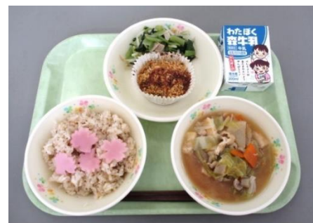
【入間市とのコラボメニュー】

★学校給食費値上げ相当額の補助 ○学校給食調理コンクールへの参加 ○季節・行事食や郷土食による給食を通じた食育の推進