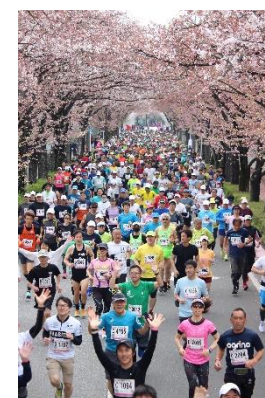
【さくらマラソン大会】