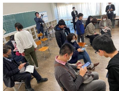
【ICT サロン～子どもも大人も善き使い手に～】