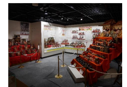
【郷土資料館 企画展「雛まつり」】