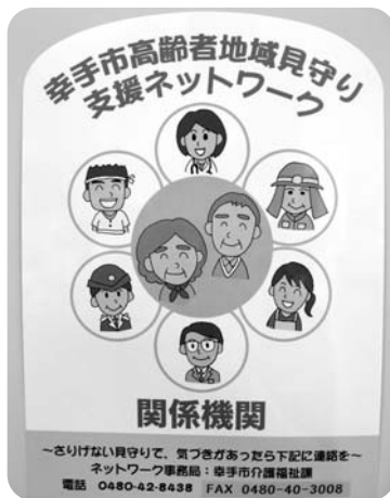
▲ネットワークステッカー

高齢者が安心して住み慣れた地域で生活していけるよう、地域住民、関係機関および行政が連携して、地域全体で高齢者を見守る体制を整え、効果的な支援を行うことを目的として平成23年2月15日「幸手市高齢者地域見守り支援ネットワーク」が立ち上げられました。