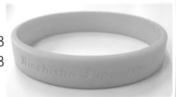
▲認知症サポーターオレンジリング

介護福祉課高齢福祉担当(ネットワーク事務局) ☎(42)8438・FAX(40)3008 幸手東地域包括支援センター(ウェルス幸手内) ☎(42)8438・FAX(40)3008 幸手西地域包括支援センター(西公民館内) ☎(40)3443・FAX(44)0870