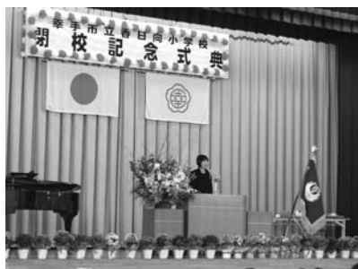
▲閉校記念式典の様子

地域と共にあった香日向小学校。児童の生き生きと活動する声絶えなかつた学び舎に、静寂が訪れようとしています。