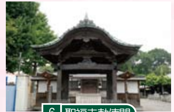
6 聖福寺勅使門 唐破風の勇壮な四脚門。聖福寺は日光社参の時、徳川将軍が御昼休をとった寺。