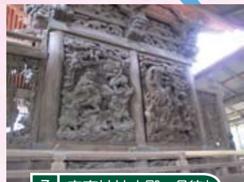
7 幸宮神社本殿の彫刻 創建より400年以上の歴史を持つ神社の本殿に施された装飾彫刻。