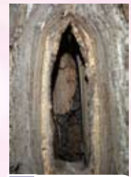
8 銀杏地蔵 樹齢400年以上といわれる大銀杏の胎内に刻まれた子育て地蔵。