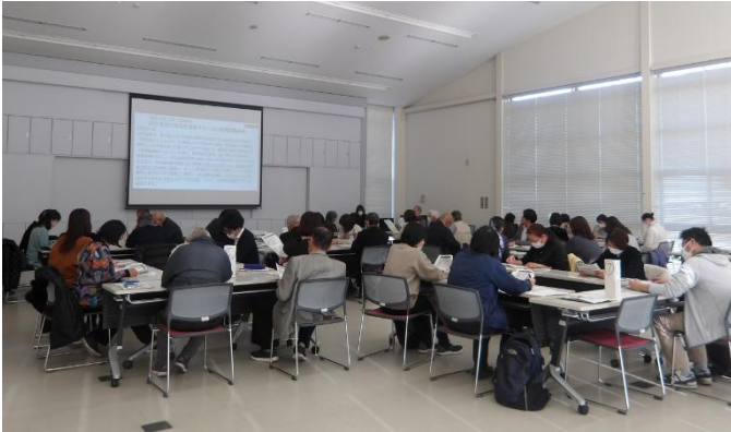
～会場及びオンラインの併用開催～

令和8年1月27日(火)ウェルス幸手において全体会を開催し、各関係機関の代表者・担当者にご参加いただきました。