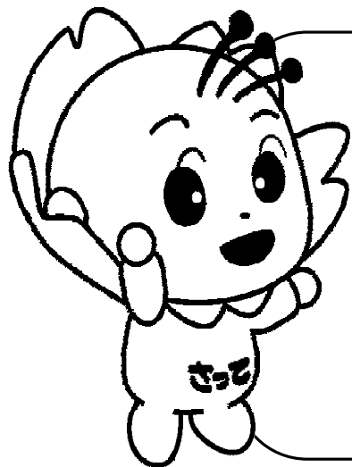
国民健康保険 保養所二次元コード