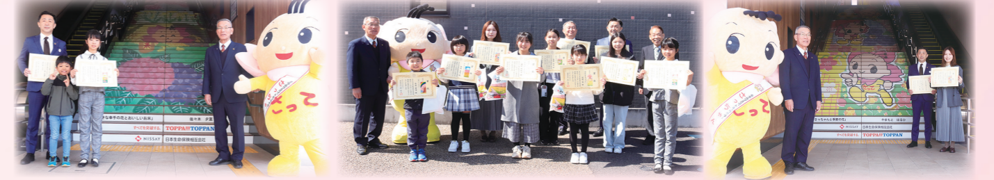
▲東口の階段アート