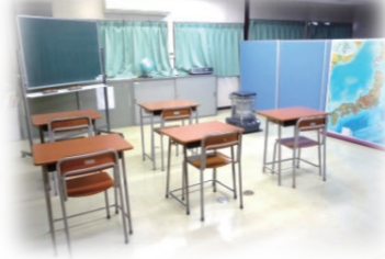
▲心すこやか支援室

心すこやか支援室では、個別の教育相談も行っています。必要に応じてスクールカウンセラーとの相談も可能です。相談、施設見学のご希望がありましたら心すこやか支援室にご連絡ください。