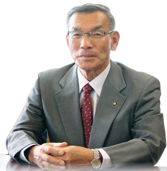
幸手市長 木村純夫

※公共施設アセットマネジメントとは、持続可能な社会を維持するため、施設の集約、複合化を進め、機能の充実を図ること。