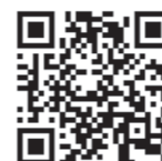
市長メッセージ 動画配信

幸手市では「幸手市新型コロナウイルス対策本部」を設置し、感染拡大防止に全力で取り組んでいます。